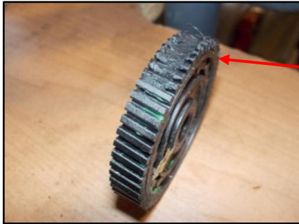
Desgaste del piñón del actuador.

Una vez reparado el motor, se vuelve a montar y se hace un ajuste para la correcta adaptación